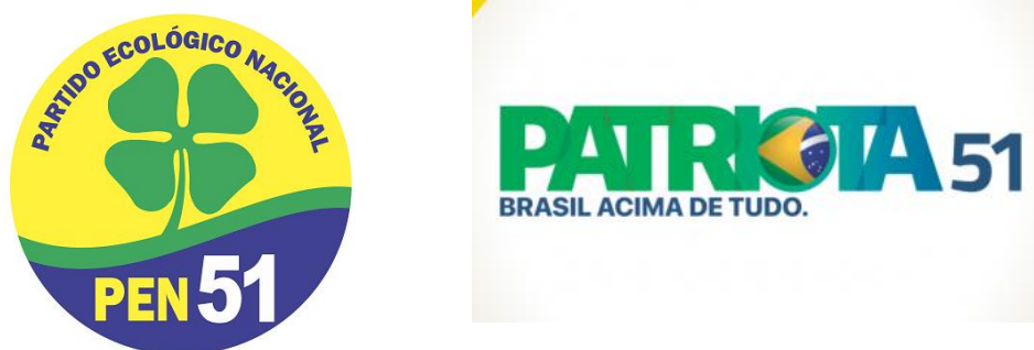
Imagen 1 y 2 – (1) logo del PEN (derecha), (2) logo del Patriota (izquierda).