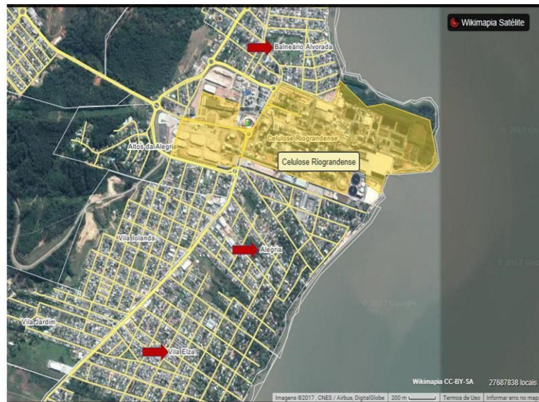
Figura 1 - Ubicación de la fábrica CMPC y barrios circundantes