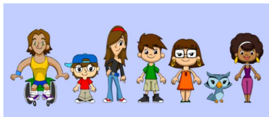
Figura 5 – Novos personagens

Muito conteúdo já foi produzido, principalmente o de cunho informacional. A ideia agora é moderar contribuições enviadas pelo público-alvo e focar nas pautas relacionadas ao empoderamento infantil.