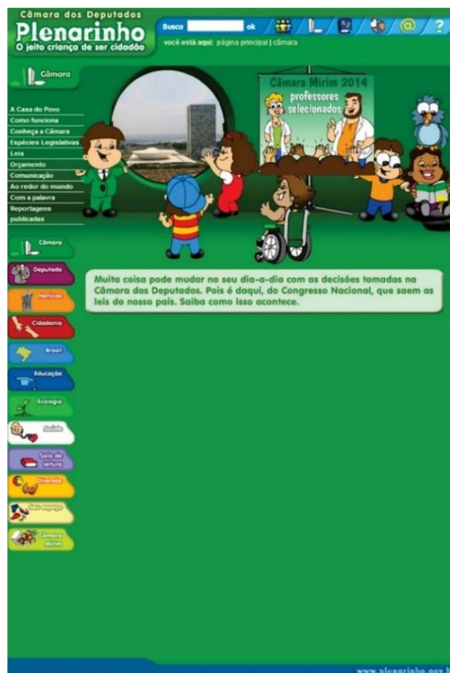
Figura 2 – Página interna: Câmara