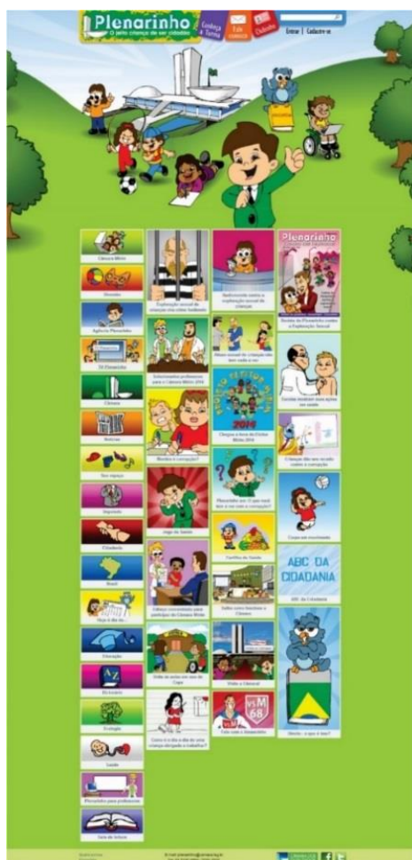
Figura 1 – Homepage

Hoje, o menu principal do Plenarinho se divide por assuntos (Câmara, Deputado, Cidadania, Brasil, Educação, Ecologia, Saúde), outras categorias (Notícias, Sala de Leitura, Diversão, Seu Espaço) e ainda programas (Câmara Mirim) (Figuras 1 e 2).