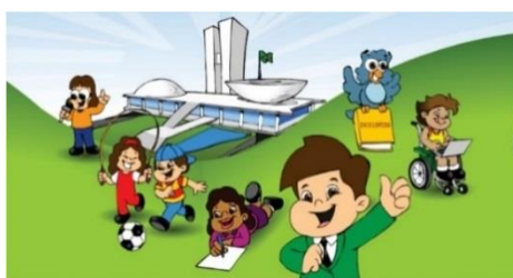
Figura 4 – Personagens originais

Em 2005, um concurso com a participação de cerca de 500 crianças definiu as características do sétimo personagem, o cadeirante Vital, representante da acessibilidade. Outros aparecem em situações específicas, como a professora Josefa. Os personagens ilustram e apresentam textos, figuram em histórias e quadrinhos, animações, jogos e infográficos.